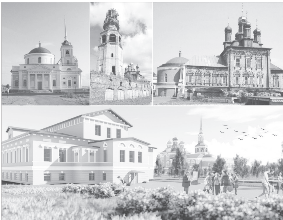
📌 Проект «Усолье. Регенерация культуры» предусматривает нетиповое благоустройство и реставрацию исторического и архитектурного пространства. / ФОТО ПРЕДОСТАВЛЕНО ПРЕСС-СЛУЖБОЙ АДМИНИСТРАЦИИ Г. БЕРЕЗНИКИ

Мы особо выделяем «Усолье Строгановское». Проект «Усолье. Регенерация культуры» предусматривает нетиповое благоустройство и реставрацию исторического и архитектурного пространства в центре комплекса. В настоящее время завершается проверка ПСД, готовим кон-