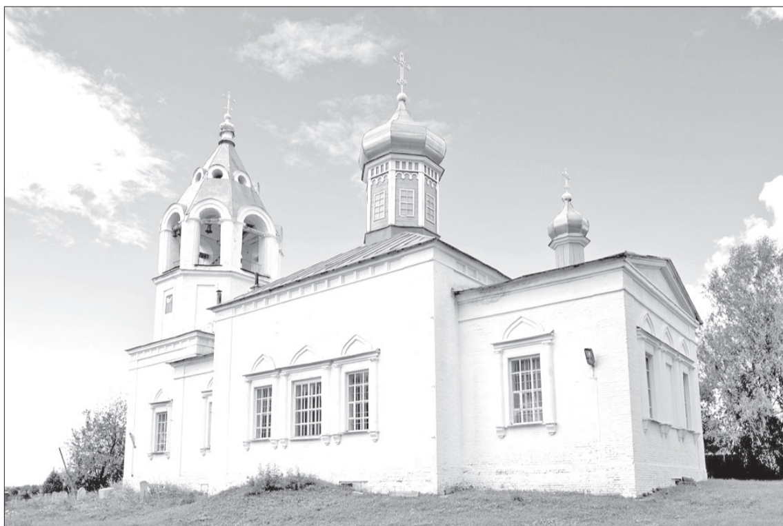
Освящение Романовской церкви во имя Сретения Господня состоялось 31 января 1867 года.

20 лет храм был в недостроенном состоянии. Фактически без крыши, окон и дверей строение под действием дождя, снега и ветра разрушалось. Жители села, окончательно потерявшие надежду на открытие церкви, довольствовались переоб-