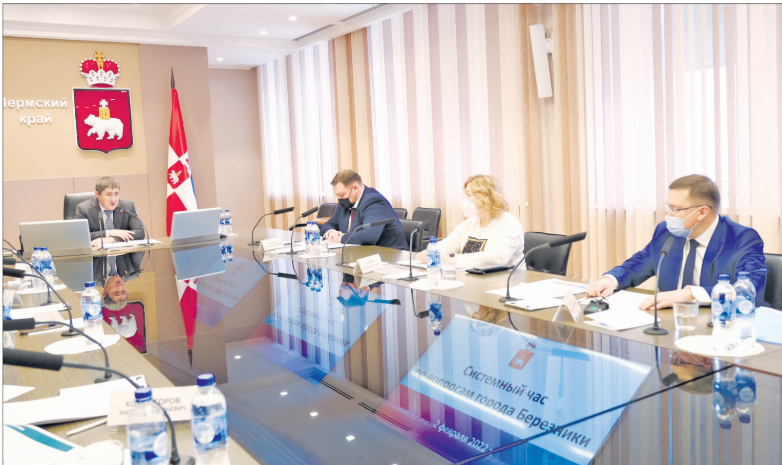
На рабочем совещании в правительстве Пермского края под руководством губернатора Дмитрия Махонина заслушали доклад о муниципальном образовании «Город Березники».