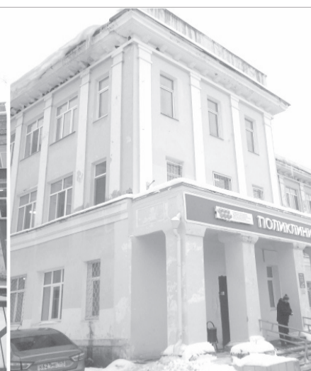
В краткосрочной перспективе необходимо выполнить ремонт 27 фасадов. Также требуется выполнить ремонт фасадов на пяти зданиях, находящихся в краевой собственности.