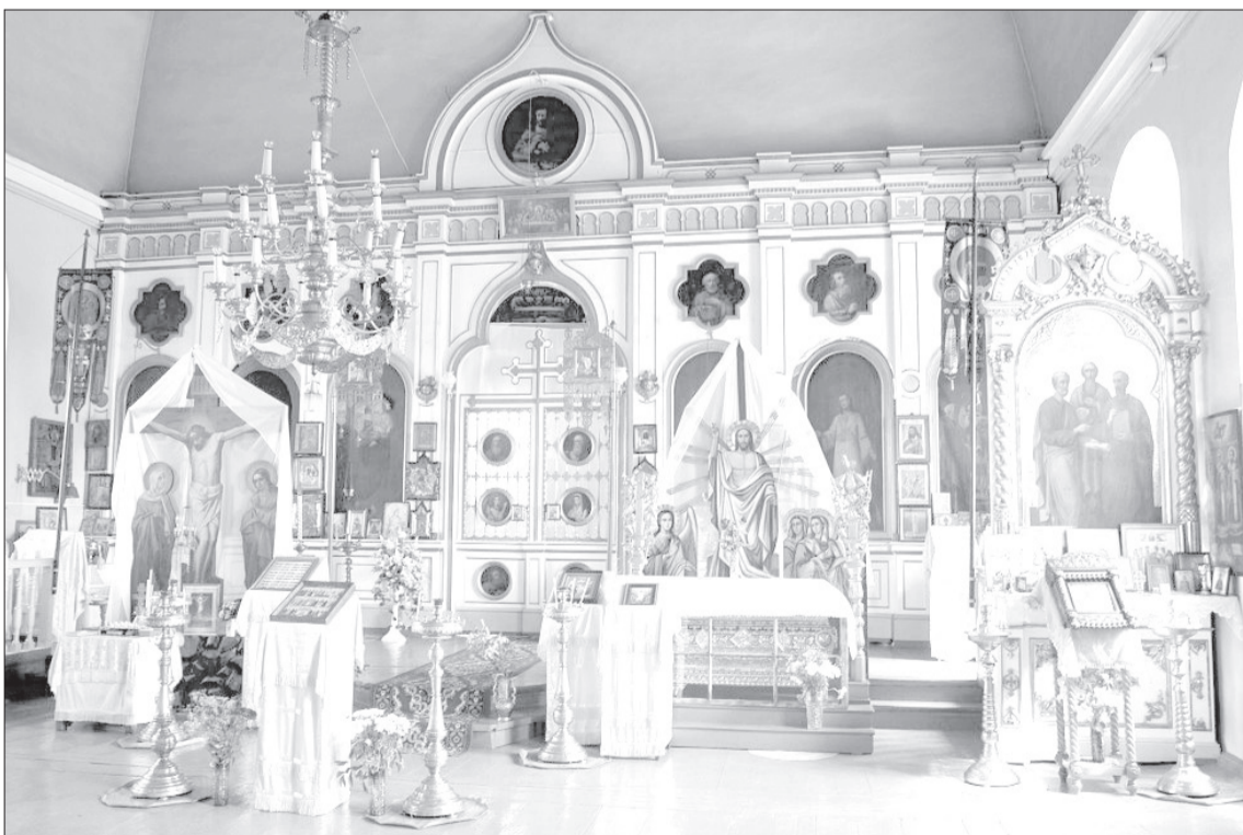
Иконостас выполнен по проекту техника Николая Быдарина пермским мастером Евстафием Брезгиным.

В Романовском территориальном отделе в этом году намечается сразу две юбилейные даты – 375 лет отмечает деревня Зуево и 75 лет – поселок Дзержинец.