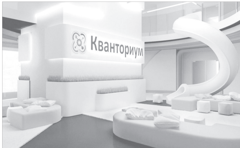
Кванториум – уникальный проект для формирования у детей технических и инженерных навыков и профориентации.