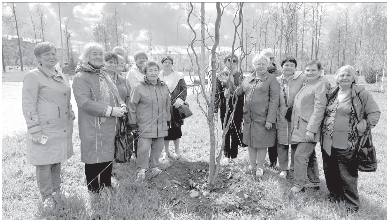
У организации ветеранов филиала «Азот» АО «ОХК «Уралхим» в парке есть именная извилистая ива.

А в парке, действительно, появляются все новые сорта деревьев. Так, осенью плани-