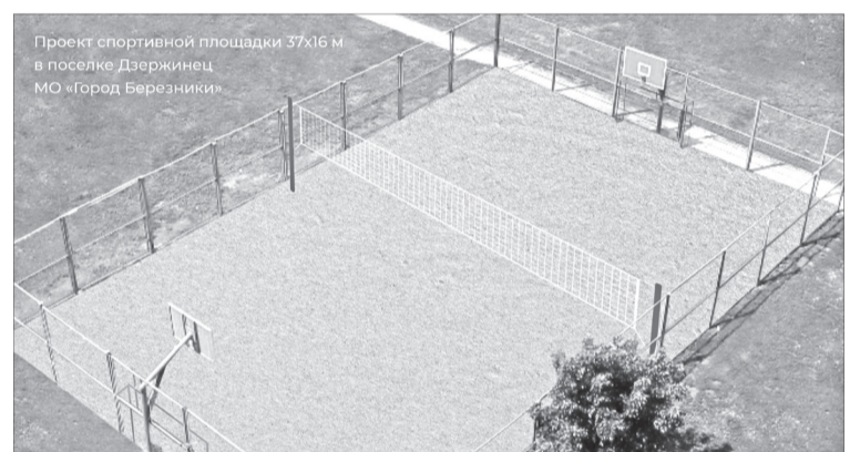
Проект спортивной площадки 37x16 м в поселке Держинец МО «Город Безрезники»