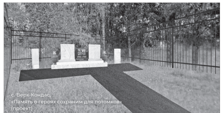
с. Верх-Кондас, «Память о героях сохраним для потомков» (проект)

Все необходимые документы участники конкурса инициативных проектов должны подать в администрацию города до 15 марта. В случае победы в конкурсном отборе, в 2023 году проекты, подготовленные инициативными жителями, будут реализованы.