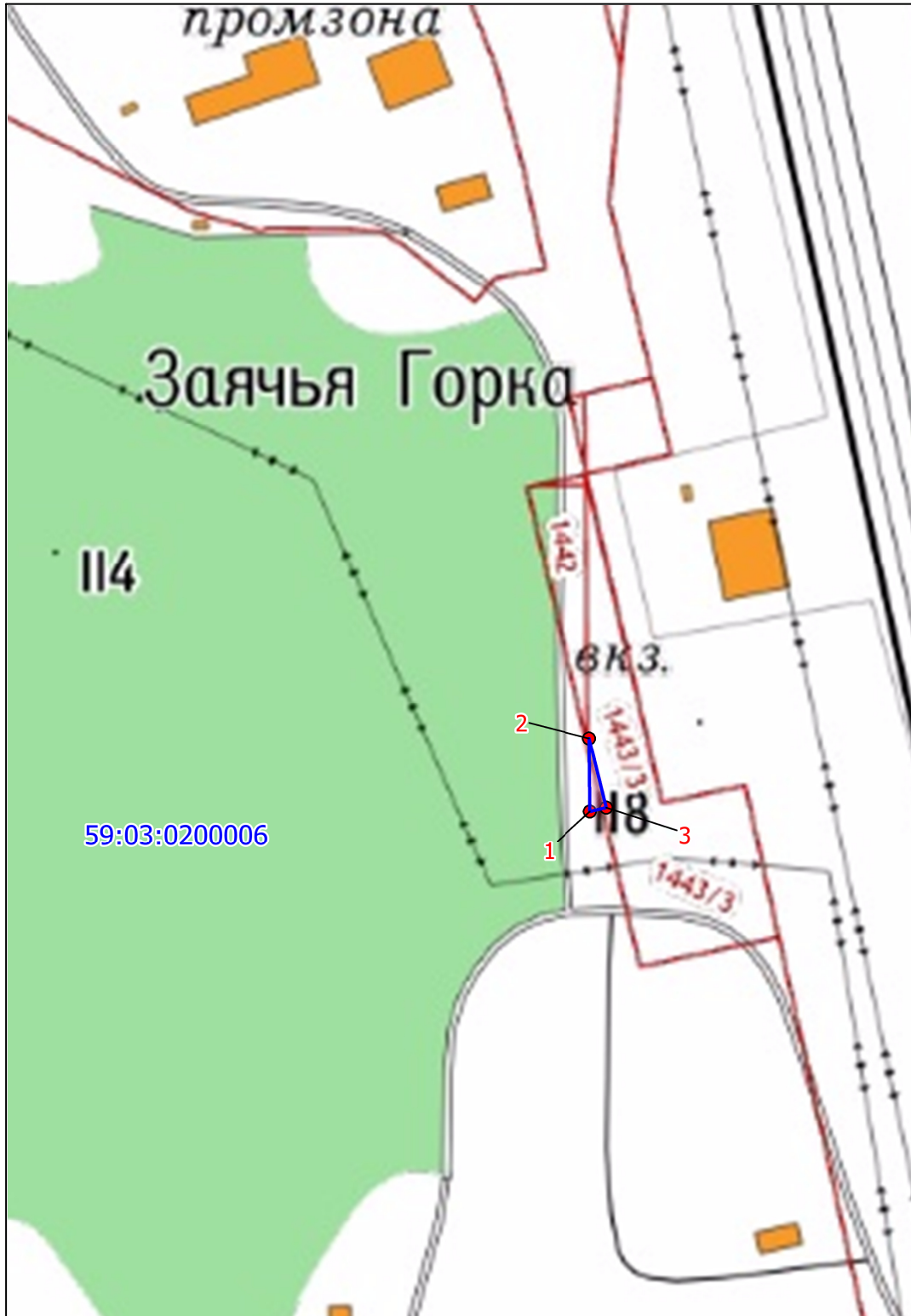
Схема расположения земельного участка