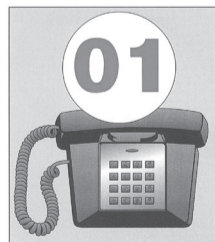
Немедленно сообщить в пожарную охрану, указав точное место (адрес) пожара, назначение здания и наличие в нём людей