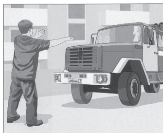
Встретить пожарные подразделения