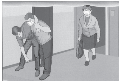
Эвакуировать людей из помещений

В первую очередь эвакуацию следует проводить используя лестничные клетки, ведущие наружу здания, а также переходы по балконам в нижние этажи и в соседние секции дома. В задымленном помещении двигаться к выходу надо пригнувшись или ползком, при возможности накрыв голову плотной тканью. Для защиты от дыма следует применять только изолирующие противогазы или фильтрующие, но с голкалитовыми патронами, а также самоспасатели изолирующие. Как исключение на короткое время можно использовать влажные повязки