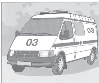
При наличии пострадавших вызвать «скорую медицинскую помощь»