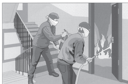
Использовать первичные средства пожаротушения

В первую очередь эвакуацию следует проводить используя лестничные клетки, ведущие наружу здания, а также переходы по балконам в нижние этажи и в соседние секции дома. В задымленном помещении двигаться к выходу надо пригнувшись или ползком, при возможности накрыв голову плотной тканью. Для защиты от дыма следует применять только изолирующие противогазы или фильтрующие, но с голкалитовыми патронами, а также самоспасатели изолирующие. Как исключение на короткое время можно использовать влажные повязки